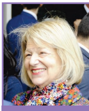
Баронесса Эмма Николсон Винтерборнская специальный торговый посланник премьер-министра Великобритании в Азербайджане