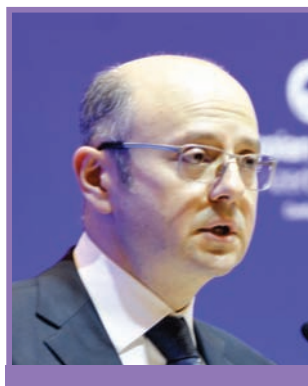
Парвиз Шахбазов, Министр энергетики Азербайджанской Республики