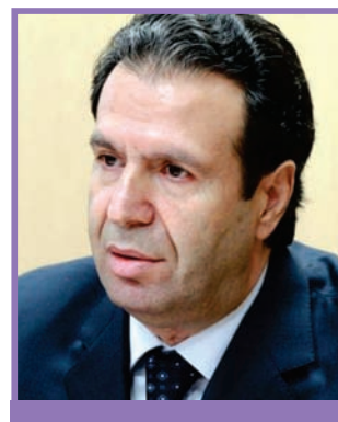
Фархад Самедов заместитель Председателя Правительства Республики Башкортостан (Российская Федерация)