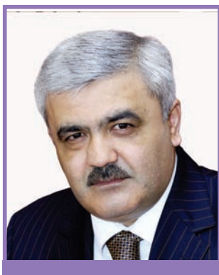
Ровнаг Абдуллаев Президент SOCAR