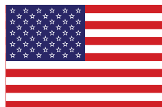
Дональд Трамп Президент Соединенных Штатов Америки