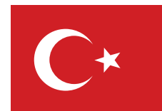
Реджеп Тайип Эрдоган Президент Турецкой Республики