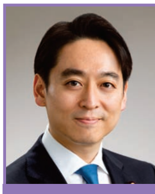
Дайсаку Хираки заместитель министра экономики, торговли и промышленности Японии