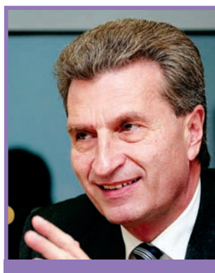
Гюнтер Оттингер, Европейский комиссар по бюджету и людским ресурсам Европейской Комиссии